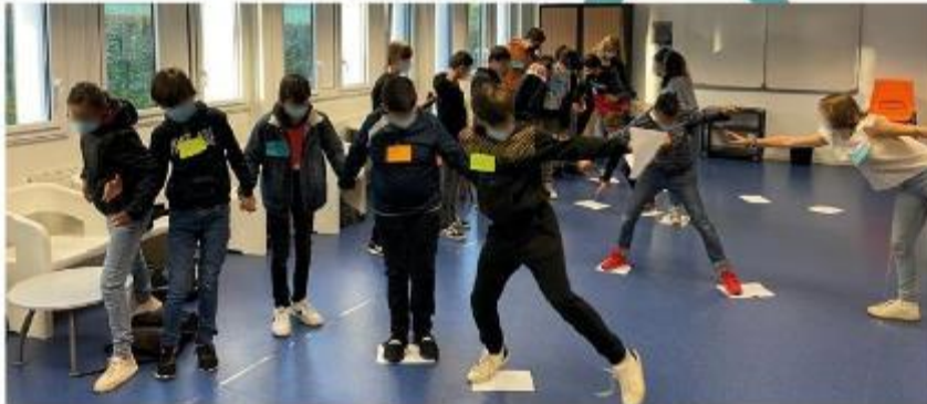
Atelier de design fiction sur le collège du futur avec les collégiens à Chantonnay lors d'une immersion (icebreaker)