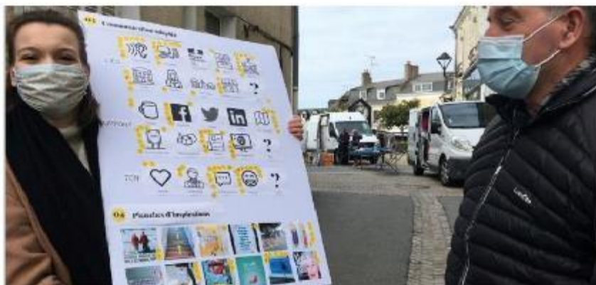
Consultation des citoyens au sujet de la stratégie de communication des France Services

Vendée, Maine-et-Loire, Loire-Atlantique, Sarthe, Mayenne