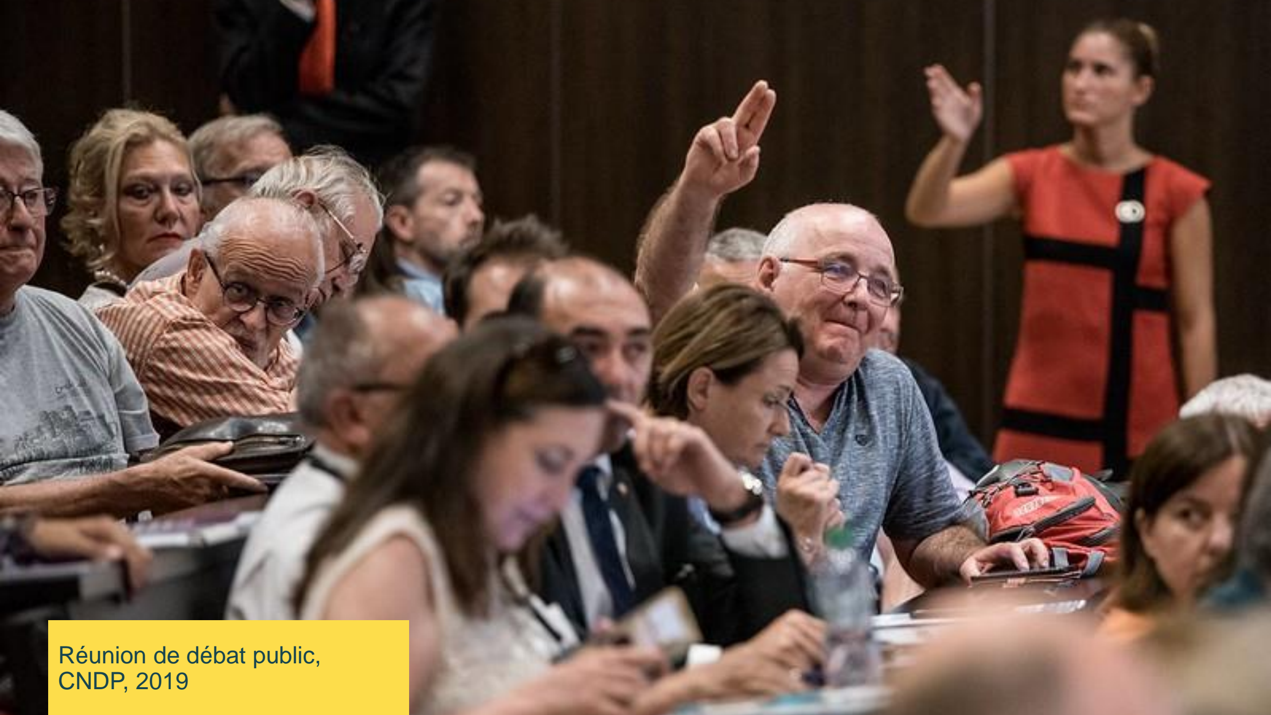
Réunion de débat public, CNDP, 2019