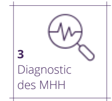
3 Diagnostic des MHH

La promenade de terrain permet d'appréhender le paysage et de mettre les mots justes sur des éléments de l'écosystème que les parties prenantes connaissent.