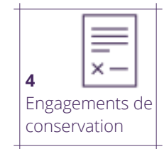
4 Engagements de conservation